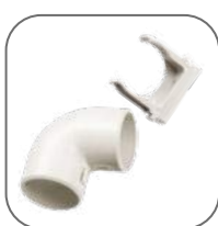
Все необходимые аксессуары