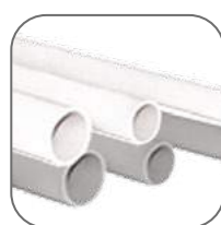
Цвет: белый, серый