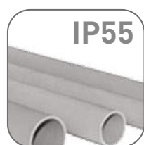
Степень защиты IP55

Серия гладких труб жесткого типа ПВХ – это профессиональная кабеленесущая система, которая предназначена для прокладки компьютерных, телефонных, электрических и других сетей, выполненных изолированными кабелями. Особенностью трубы является ее жесткость, что позволяет использовать ее для прокладки всех типов сетей в зданиях любого назначения. Ассортимент гладких труб жесткого типа EKF выполнен в сером цвете RAL 7035 и охватывает типоразмеры от 16 до 63 диаметра. Ассортимент гладких труб жесткого типа EKF выполнен в сером и белом цветах и охватывает типоразмеры от 16 до 63 диаметра.