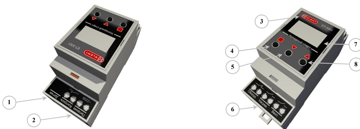
Рисунок 1 – Электронный термостат ET-3301, внешний вид:

На верхней и нижней панелях прибора расположены клеммники и разъем. Все клеммники и разъем имеют обозначение, и позволяют оперативно проконтролировать правильность подключения прибора и, при необходимости, локализовать подключение с плохим контактом.