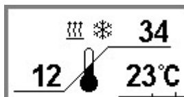
Рисунок 3 — Общий вид экрана 2.