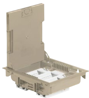
0 896 07