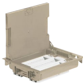
0 896 17