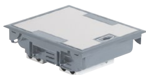
0 896 15

Напольная коробка серая с крышкой с антикоррозионным покрытием