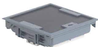
0 896 16

Напольная коробка серая с крышкой с антикоррозионным покрытием