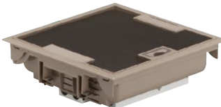
0 896 17

Напольная коробка серая с крышкой под ковровое покрытие