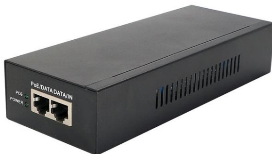
Рис.1 Midspan-1/652G, внешний вид