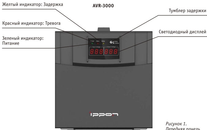
Рисунок 1. Передняя панель

Элементы управления на передней панели и светодиодные индикаторы Ниже показаны элементы управления, индикаторы и ЖК-дисплей на передней панели.